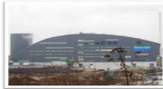
Impianto di trasformazione dei rifiuti domestici in energia a Helsingborg, Svezia