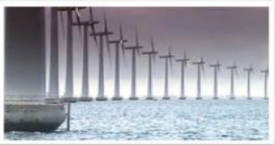
Parco eolico offshore a Øresund, Danimarca