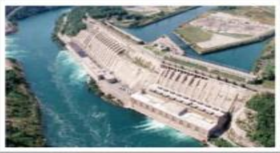
Impianto idroelettrico ad Aust-Agder, Norvegia