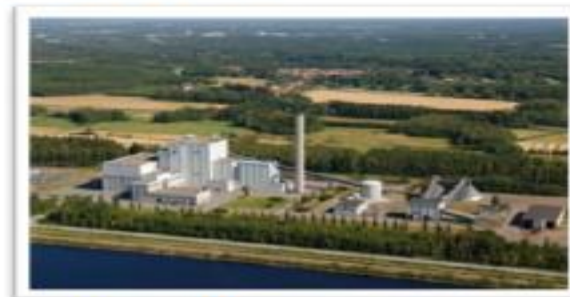
Impianto di produzione energetica da biomasse a Vaasa, Finlandia