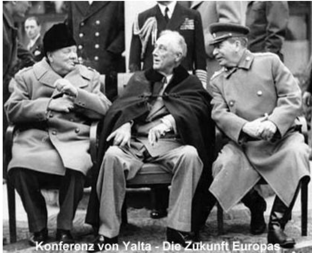
Konferenz von Yalta - Die Zukunft Europas